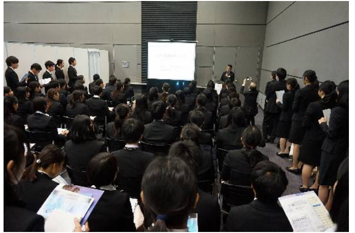
講演会「日本の物流業について」