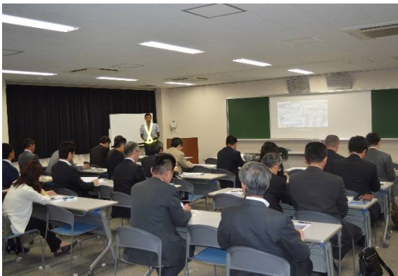
【日本貨物鉄道(株)】 吹田貨物ターミナル駅会議室