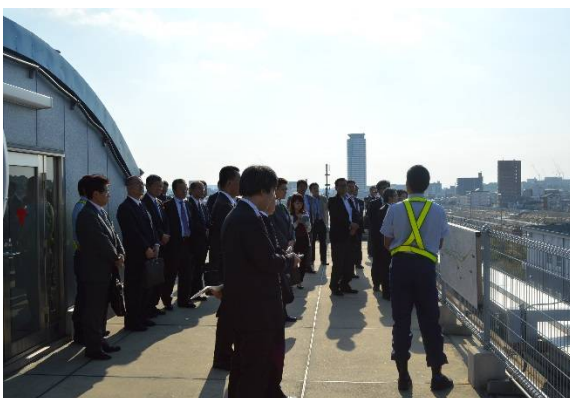
吹田貨物ターミナル駅屋上