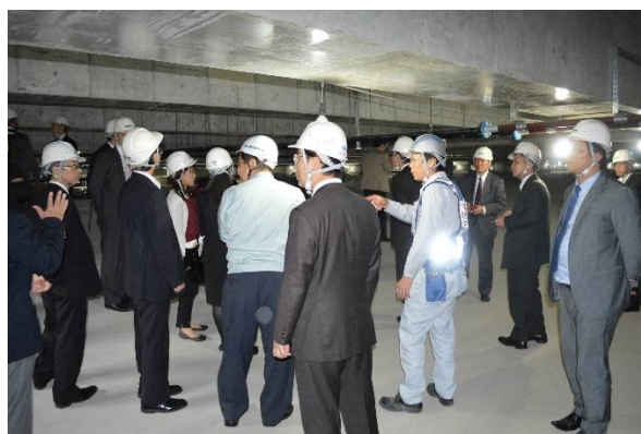
北大阪物流センター地下免震装置