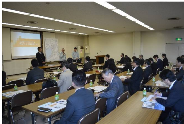
【大阪府都市開発(株)】 北大阪流通センター会議室