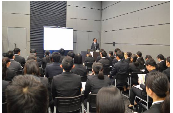
講演会「日本の物流業界について」