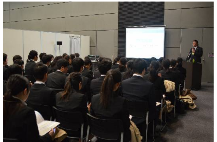
講演会「日本の物流業について」